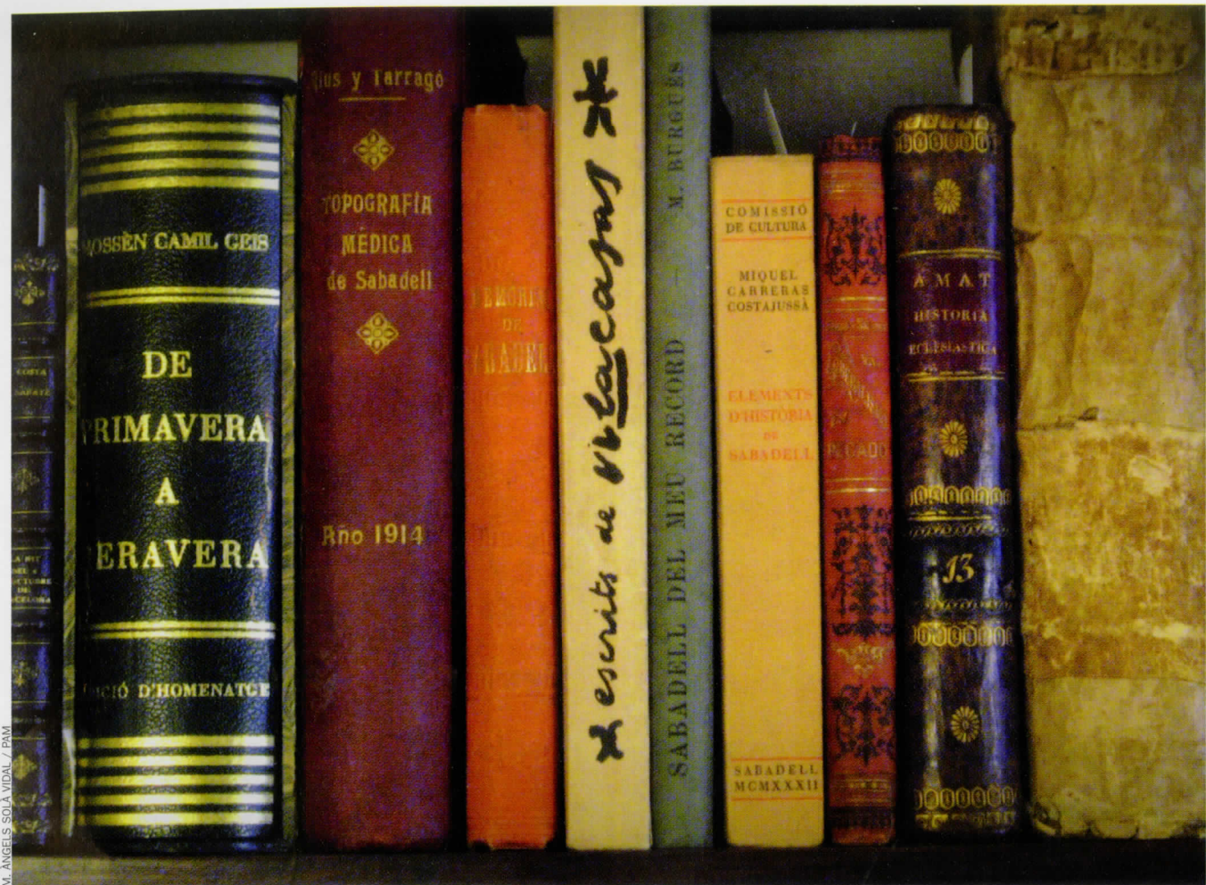
Aplec d'obres de la Col·lecció Esteve Renom - Montserrat Llonch, que ha servit de base per al catàleg.